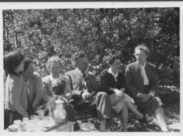
II, 19 A