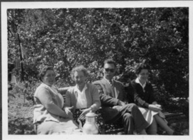
II, 16 A