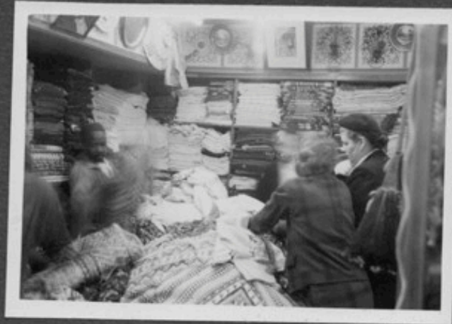
II, 34 A